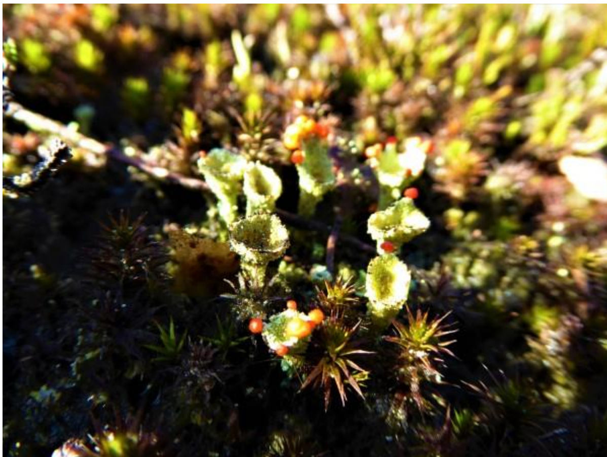
Rood en bruin bekermos