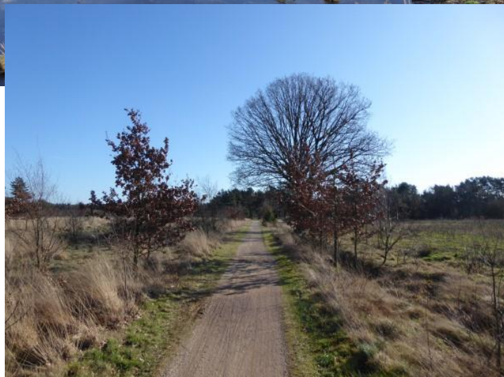
Mooie landschappen met verkleumde slobkousjes